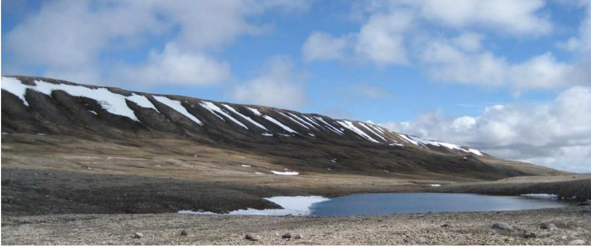
Photo du Parc Territorial Ovayok